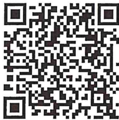
キャリナース登録数(令和2年6月末現在)