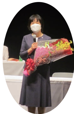
秦会長 退任あいさつ

引き続き、日本看護協会や本会各支部との連携をとりながら、会員一人ひとりの声を大切にして事業を推進していきます。ご支援ご協力をよろしくお願いいたします。