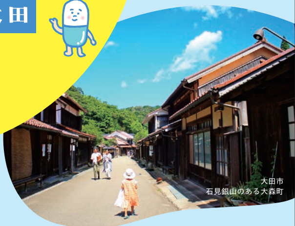
大田市 石見銀山のある大森町