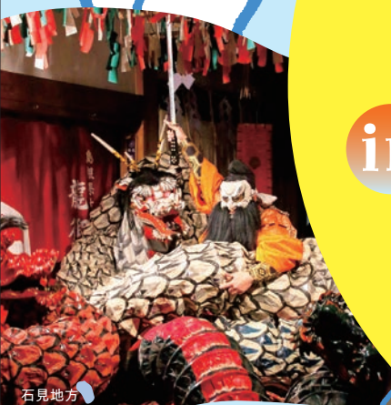
石見地方 石見神樂